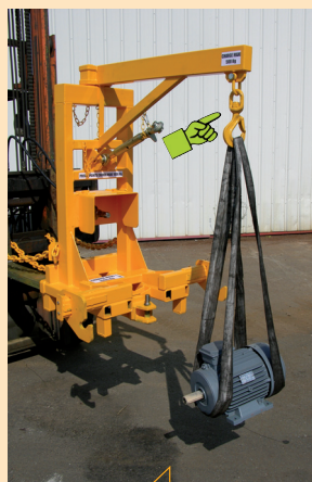
Levage avec crochet tournant